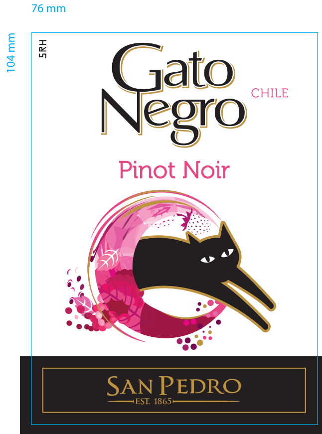
Aplicación Negro Flexo Esc. 50%